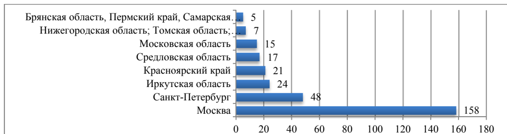
Рисунок 1 – Распределение благотворительных фандрайзинговых фондов по регионам ( http://www.rusfond.ru/navigator )

Анализ социально-значимых проектов в области физической культуры и спорта по регионам Российской Федерации показывает их невысокую долю, что объясняется финансовыми проблемами в ряде регионов, в связи с чем все более актуализируется потребность в развитии фандрайзинга в регионах.