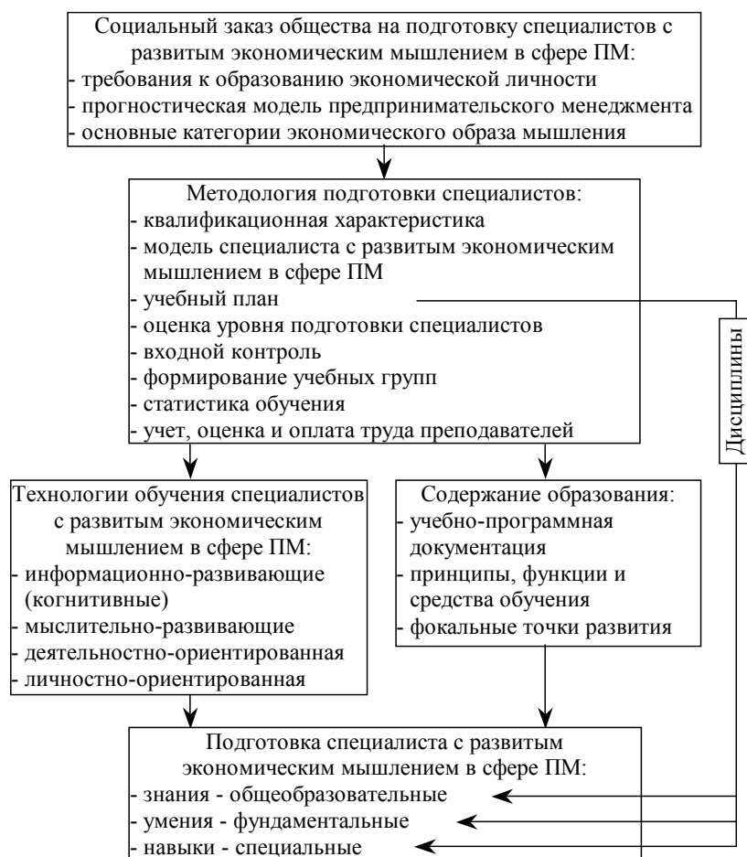
Рис.1. Модель развития предпринимательского мышления в процессе обучения менеджеров

По мнению опрошенных педагогов и студентов одного из вузов спортивной направленности данный личностно-развивающий подход к обучению способствует наиболее полной реализации принципов: всестороннего развития личности; учета особенностей развития учащихся; связи обучения с жизнью. Сущность данного подхода состоит в создании условий для целостного проявления, развития и самореализации субъектов образовательного процесса.