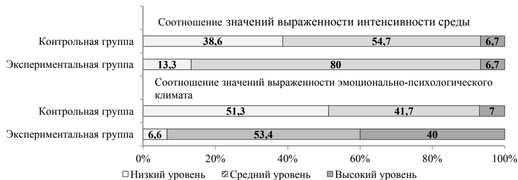
Рисунок 1 – Соотношение значений выраженности интенсивности и эмоционально-психологического климата физкультурно-спортивной среды по результатам анкетирования респондентов контрольной и экспериментальной группы после эксперимента

Необходимо отметить, что до эксперимента нормативные значения выраженности факторов среды в обеих группах были примерно идентичные и имели, в основном «низкие» и «средние» значения. После эксперимента произошли существенные изменения показателей выраженности психолого-педагогических факторов и условий в экспериментальной группе относительно контрольной, а, следовательно, и перераспределение расчетных значений (рисунки 1-3)