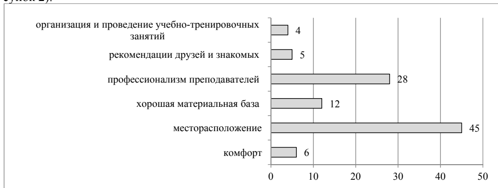
Рисунок 2 – Критерии выбора спортивного учреждения, %

В ходе исследования выяснилось, что среди критериев, влияющих на выбор спортивного учреждения, огромную роль играет месторасположение (45,0%), профессионализм преподавателей (28,0%), хорошая материальная база (12,0%). На последнем месте респонденты указали такие критерии как комфорт (6,0%), рекомендации знакомых и друзей (5,0%), а также организацию и проведение учебно-тренировочных занятий (4,0%) (рисунок 2).