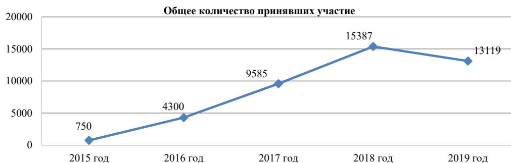
Рисунок 1 – Показатели реализации Всероссийского физкультурно-спортивного комплекса ГТО в динамике с 2015 по 2019 год в г. Хабаровске

По официальным данным общее количество принявших участие в сдачи нормативов с момента вступления комплекса в реализацию и по сегодняшний день значительно выросло. Наиболее резкий подъем наблюдается с 2015 по 2018 год, затем незначительный спад, но в целом показатели за весь исследуемый период с 2015 по 2019 год выросли в 17,5 раз, следовательно, очевиден рост положительной динамики реализации комплекса. График динамики этих показателей отражен на рисунке 1.