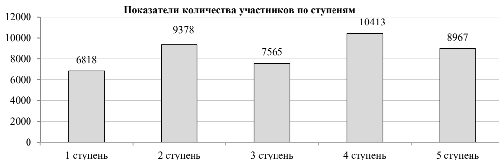
Рисунок 3 – Показатели количества участников по ступеням

Возрастной диапазон школьников принявших участие в сдачи нормативов распределились следующим образом, они отражены на рисунке 3.