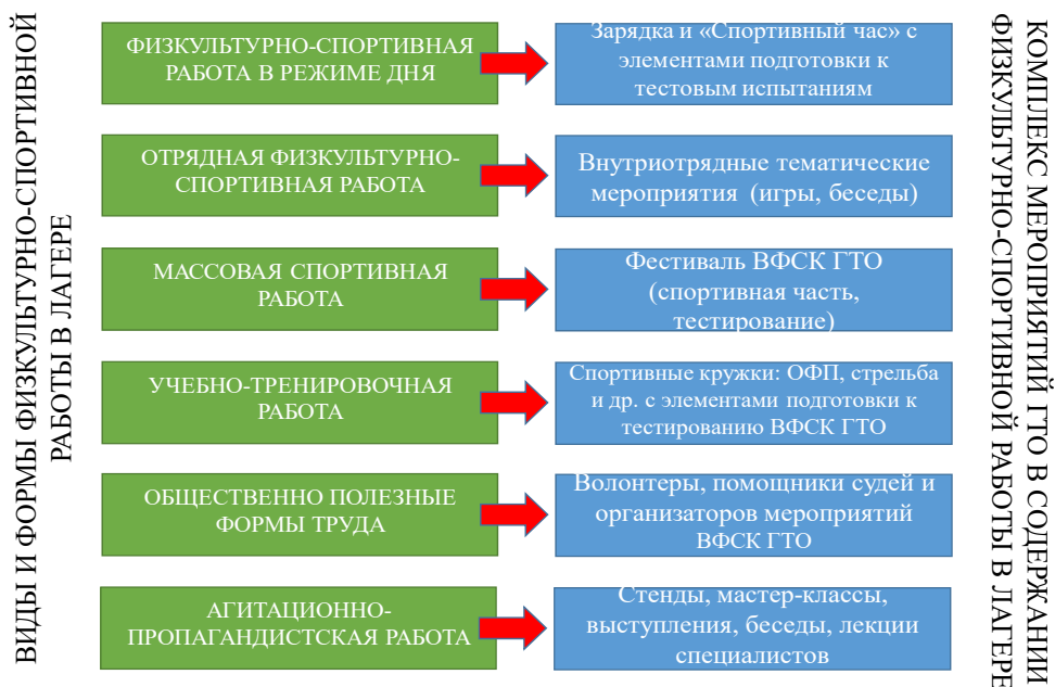
Рисунок 2 – Комплекс мероприятий внедрения ВФСК ГТО в физкультурно-спортивную работу лагеря

Важной составляющей разработанной технологии являются организационно-педагогические условия. Под организационно-педагогическими условиями понимается совокупность возможностей пространственно-образовательной среды, реализация которых обеспечивает целенаправленное функционирование и развитие педагогической системы (технологии) [1].