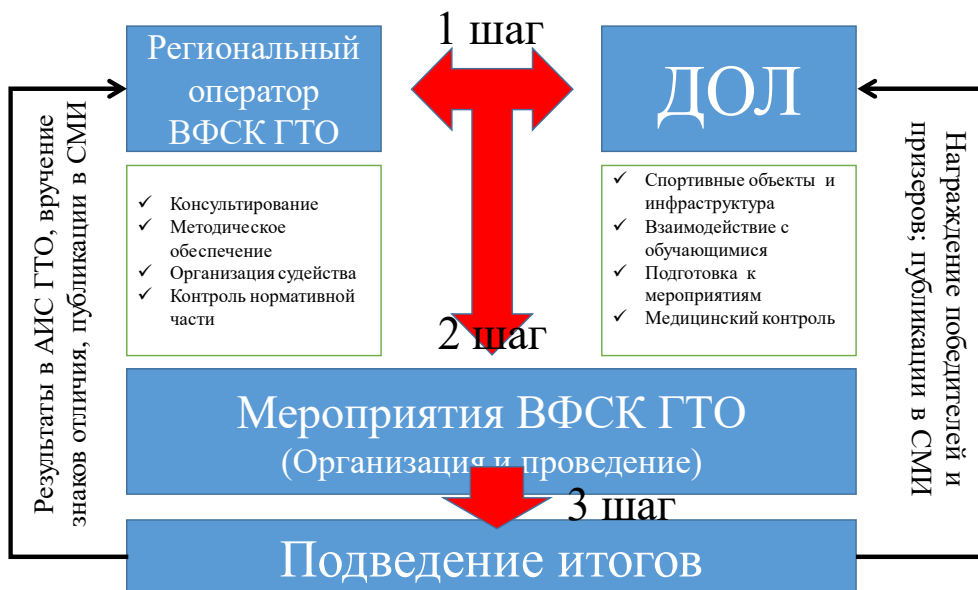
Рисунок 1 – Организационно-педагогические условия внедрения ВФСК ГТО

На втором этапе для полноценной подготовки к сдаче норм ВФСК ГТО нами был разработан и предложен к реализации комплекс физкультурно-спортивных мероприятий (рисунок 2), составленный с учетом современных требований к организации физкультурно-спортивной работы в лагере, методических рекомендаций по организации и выполнению нормативов испытаний (тестов), подготовке населения к выполнению нормативов и требований Всероссийского физкультурно-спортивного комплекса «Готов к труду и обороне» [2; 3; 4; 5].