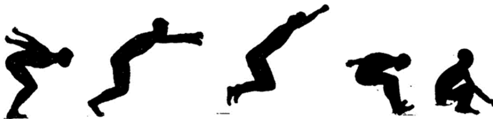
Рисунок 1 – Фазы прыжка с информативностью более 80%.

При разработке демонстрационных материалов для экспериментальной группы учитывалась информативность фаз прыжка в длину с места, определяемая на основании экспертных оценок [5, с. 87-97]. Из 12-ти фаз прыжка в длину с места были выбраны пять фаз прыжка с информативностью более 80 % (рисунок 1), которые затем использовались в ИКТ.